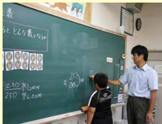
3年算数科「かけ算の筆算」十倍した数について調べているところ

公開研究会では、授業の前に全体会を行うことで、参加される先生達もポイントを絞って授業を観ることができるのではないかと考えています。忌憚のないご意見をどうぞよろしくお願いいたします。