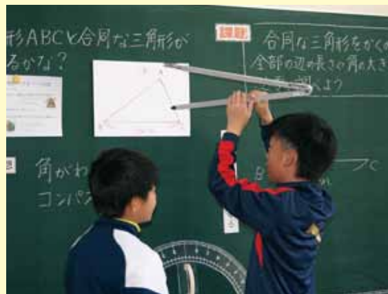
5年算数科「合同な図形」合同な図形をかくために調べているところ